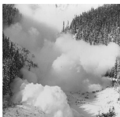
Pour la santé comme pour le ski, attention au "tout schuss" !

En répondant à l'appel à projets de la Région Rhône-Alpes pour l'éducation à la santé des jeunes de 16 à 25 ans, l'association s'est donnée pour objectif "de diminuer et de prévenir les risques liés à des conduites excessives spécifiques aux conditions de vie saisonnière", aussi bien auprès des saisonniers que des habitants à l'année de la station.